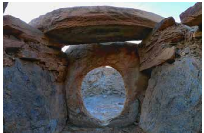
Proyecto N° 38: Sepultura 12 de la necrópolis de Los Milanes (Abla, Almería)