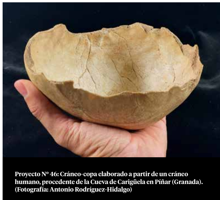
Proyecto N° 46: Cráneo-copa elaborado a partir de un cráneo humano, procedente de la Cueva de Carigüela en Píñar (Granada).