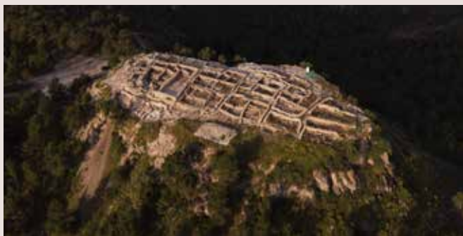
La Almoloya a vista de pájaro, en Murcia.

El proyecto, liderado por un equipo de investigadores adscritos a la Facultad de Filosofía y Letras y al Departamento de Prehistoria de la Universitat Autònoma de Barcelona (UAB), abre las puertas a ampliar el conocimiento de la cultura del Argar a través de un proyecto que investiga las desigualdades políticas y económicas de una de las culturas más significativas en la Edad de Bronce. La cultura del Argar tiene papel protagonista en el conocimiento de la Prehistoria reciente en España, y es considerada una de las culturas más relevantes de la Edad del Bronce en Europa. El Argar no es una cultura arqueológica más. Su principal característica fue la instauración de agudas desigualdades políticas y económicas, con gran relevancia patrimonial, cultural y económica.