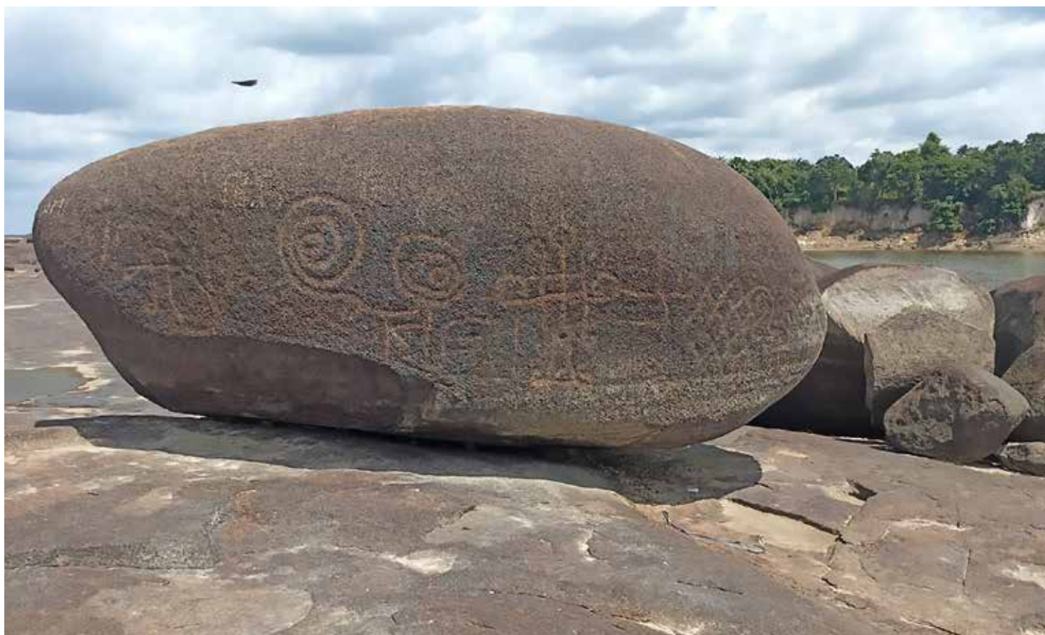
Proyecto N° 44: Bloque con petroglifos en el parque Amarrú, comunidad indígena de Coco Viejo, Inírida, Guainía, Colombia.

27-Proyecto: TIPASA. Ocupación, producción e interconexiones en el territorio de una ciudad africana durante la Antigüedad – Argelia