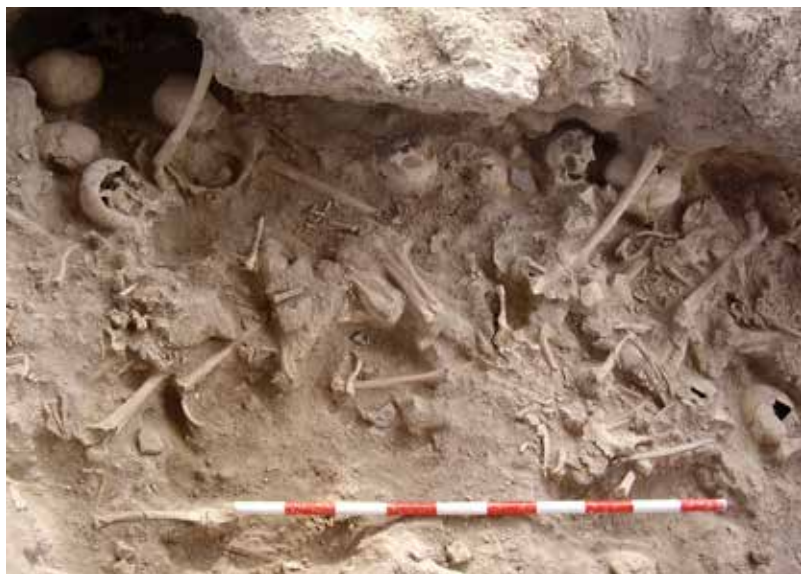
Proyecto Nº 6: Primeras y segundas inhumaciones en un sector perimetral del enterramiento múltiple calcolítico de Camino del Molino (Caravaca de la Cruz, Murcia)