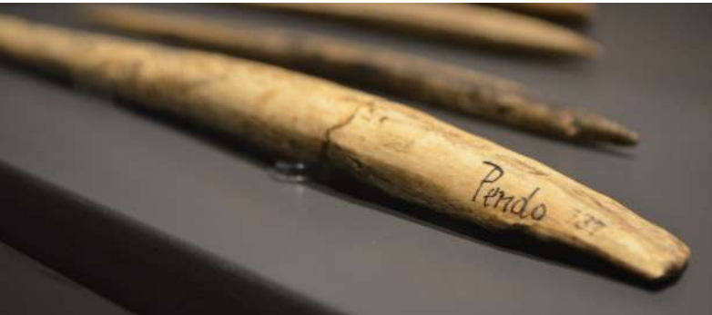
Azagayas en hueso del Paleolítico superior de las excavaciones de la Cueva del Pendo, Cantabria. Proyecto nº44.