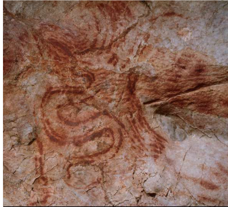
Oxidos de hierro usadas como pigmento en la Cueva de Lonín - Asturias. Proyecto nº 25.