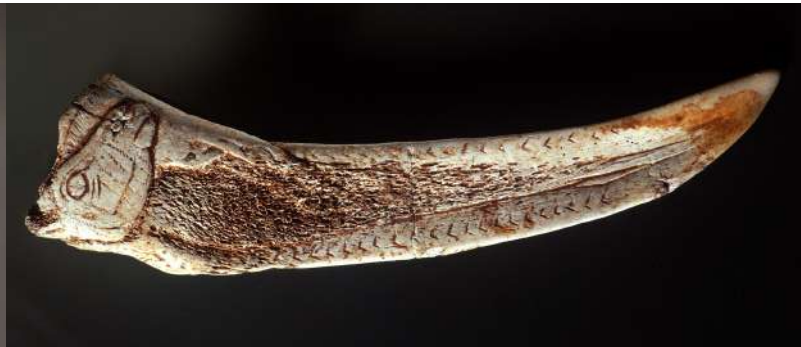
Espátula Magdaleniense con representación de cabra montés. La Garma Cantabria. Proyecto nº39.