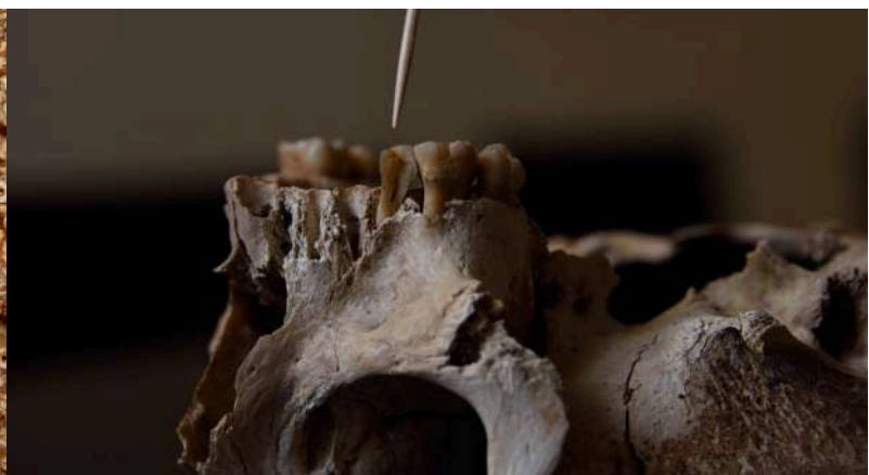
Restos de un individuo, probablemente de sexo femenino, de unos 15 años de edad perteneciente almitad del II milenio a.n.e. Proyecto nº34.