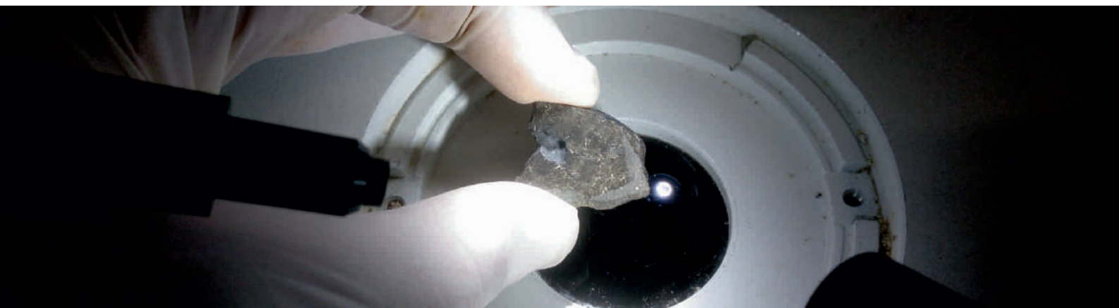
Análisis bajo estereomicroscopio (10X) de la superficie pulida de una muestra pétrea procedente del yacimiento de Carranque. Proyecto nº17.