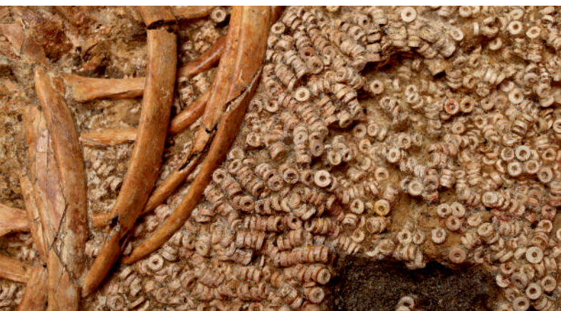
Cuentas perforadas de concha maría pertenecientes a un individuo de la Edad de Bronce encontradas en Montelirio-Sevilla. Proyecto nº50.