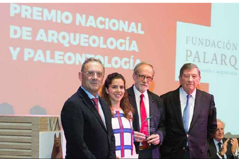
Entrega del Premio Nacional de Arqueología y Paleontología Fundación Palarq en el Museo Arqueológico Nacional de Madrid.

Más información en www.fundacionpalarq.com